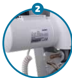
Motor eléctrico para la elevación