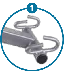
Percha con 4 puntos de seguridad