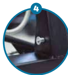
Quick Release para un fácil plegado Disponible para Grúa Aúpa Mini