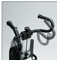
Timón regulable en altura y ajustable para adaptarlo al cuidador.