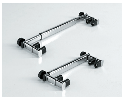
Barra ajustable para el Yack 962 y Yack 963.