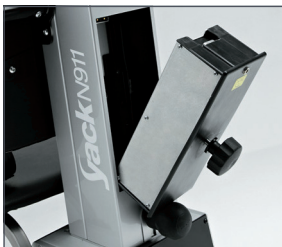
Batería desmontable para facilitar la recarga.

El Yack es el salva escaleras que permite subir y bajar escaleras rectas y de caracol. Se va adaptando a las necesidades del paciente, pasando del modo asiento (Yack 961) al modo silla de ruedas (Yack 962 / 963). Desmontable en diferentes secciones para facilitar su traslado. Con batería desmontable que permite su recarga sin mover todo el equipo.