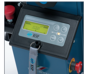
Nuevo panel de control digital que permite introducir al cuidador diversos parámetros (velocidad, modo de subir las escaleras -individualmente/ciclo continuo...) garantizando un uso seguro y simple del sube escaleras.