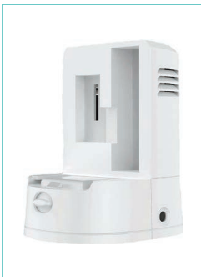
Base de carga externa