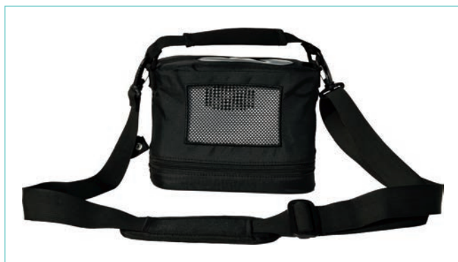
El POC incluye bolsa de transporte