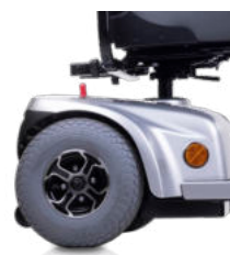
Parte lateral del scooter